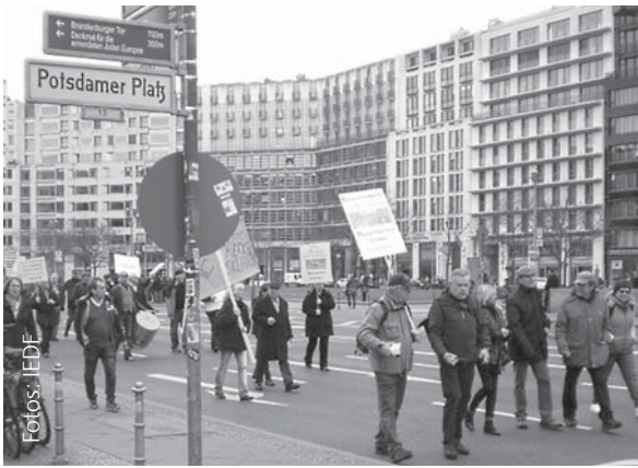
Am Potsdamer Platz.

Bestrafung zu sorgen“, sagte der IEDF-Vorsitzende.